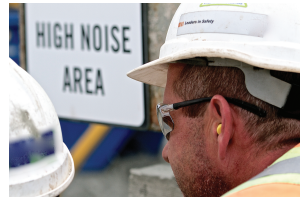
Trabajador que usa tapones para los oídos para la protección auditiva.

Pídale a su empleador que alquile o que compre equipo de bajo ruido o ponga una barrera para absorber el ruido alrededor de equipo ruidoso, como los compresores.