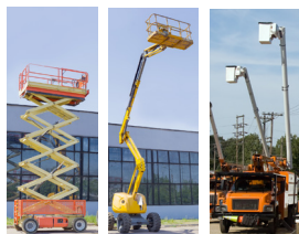
Un elevador de tijera (izquierda), un camión grúa de carga (en el centro), y una plataforma hidráulica (derecho).

Una plataforma aérea puede prevenir caídas y reducir los riesgos de lesiones en la espalda, el cuello y los hombros causadas por trabajar al nivel del hombro o por encima de él ya que lo pone en el lugar exacto donde le toca trabajar.