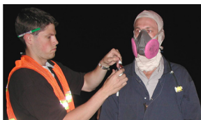
Si hay riesgo de que haya berilio transmitido por el aire en el área de trabajo, la exposición deberá ser monitoreada