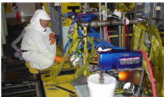
HANFORD NUCLEAR RESERVATION, WASHINGTON STATE

Respirar el polvo de berilio o tocar superficies contaminadas con polvo de berilio, puede provocar la enfermedad crónica del berilio (en inglés, CBD). La CBD es una enfermedad de cicatrices en los pulmones que puede causar tos, dificultad para respirar y fatiga.