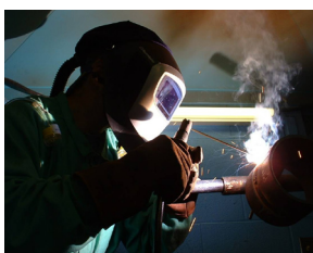
Un respirador con suministro de aire brinda un nivel alto de protección

Su empleador debe asegurarse de no exponerlo haciendo una prueba para verificar que no haya polvo de berilio en el aire. También se puede usar una prueba de sangre para identificar la sensibilización al berilio, lo cual incrementa el riesgo de la enfermedad.