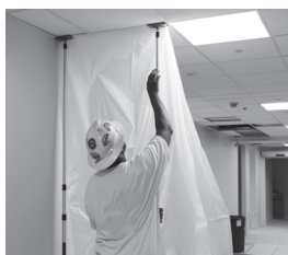
Trabajador que establece un área de contención durante una clase de entrenamiento de ICRA.

Pida capacitación a su empleador o sindicato.