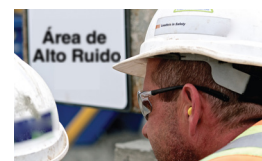
Trabajador que usa tapones para los oídos para la protección auditiva.

Según la OSHA su empleador debe proporcionarle protección para los oídos cuando trabaja alrededor de ruidos fuertes.* Los tipos de protección auditiva incluyen tapones para los oídos y orejeras. Asegúrese de que la protección que va usar le quede bien. Entre más ruidoso sea el trabajo más protección necesitará.