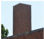
Chimenea de imitación oculta 15 antenas de panel