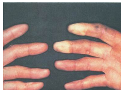
Síndrome de vibración de mano y brazo