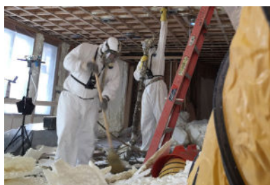
Trabajadores rozando SPF.

Usted está en riesgo si trabaja directamente con o cerca de productos que contienen estos productos químicos.