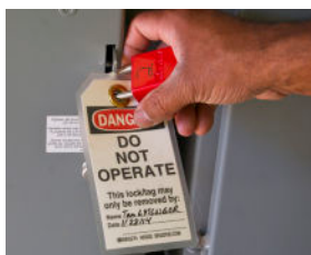
Una máquina bloqueada y etiquetada.

▶ Un dispositivo de bloqueo es una llave o cerradura de combinación que evita que el equipo se encienda o se mueva de forma imprevista.