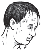
ILUSTRACIONES CORTESÍA DE CAL-OSHA

Pida ayuda si usted o un compañero demuestra estas señales. LA INSOLACIÓN ES UNA EMERGENCIA MÉDICA Y PUEDE SER FATAL. Si un compañero de trabajo demuestra señales de insolación, llame al 911.